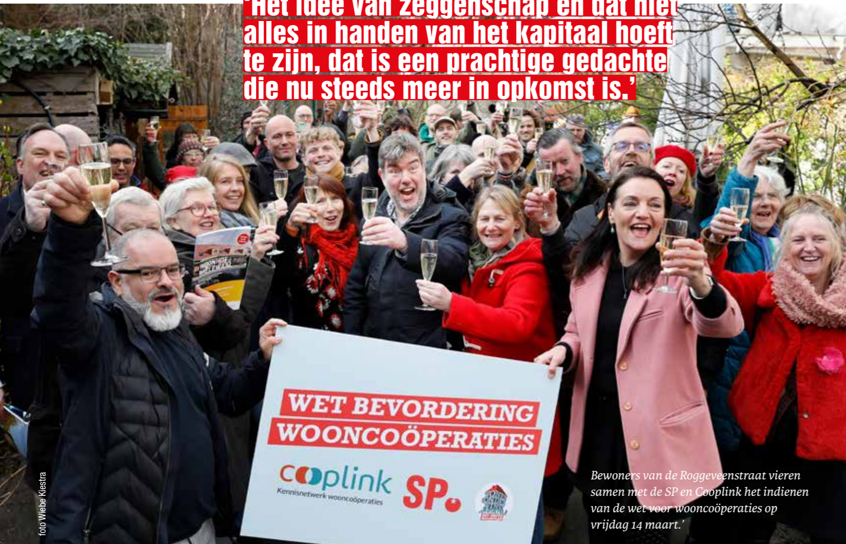
Bewoners van de Roggeveenstraat vieren samen met de SP en Cooplink het indienen van de wet voor wooncoöperaties op vrijdag 14 maart.

‘Het idee van zeggenschap en dat niet alles in handen van het kapitaal hoeft te zijn, dat is een prachtige gedachte die nu steeds meer in opkomst is.’