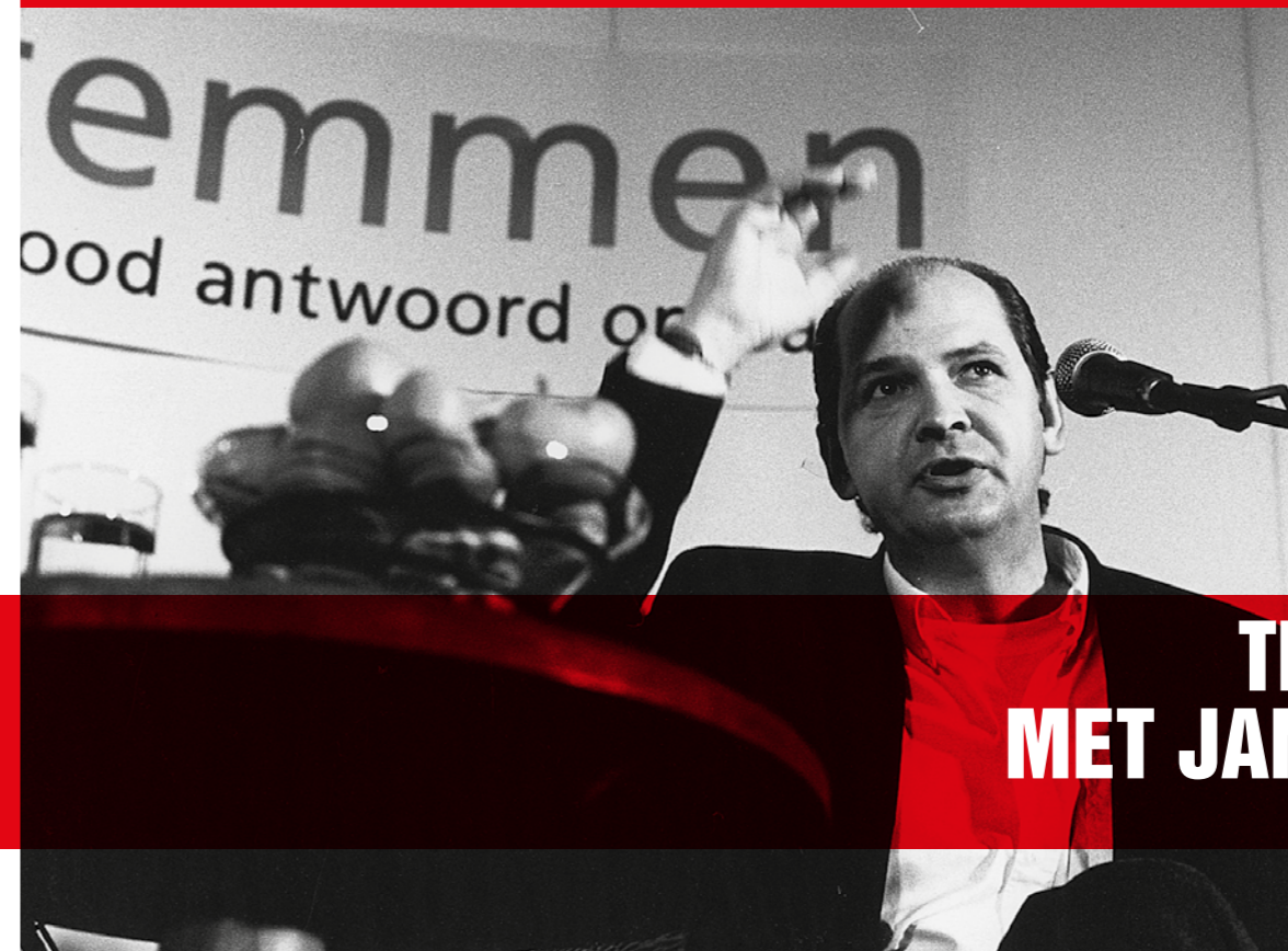
Jan Marijnissen op tour met het boek Tegenstemmen (1996). Hier in januari 1997 op een politieke bijeenkomst in Oss.