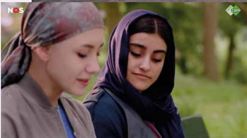
Stills uit de film 'Iedereen is van de wereld'