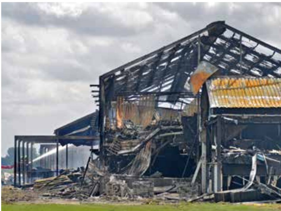
De varkensstal in Erichem na de brand.

Ook bij de stalbranden is er een structureel probleem. Futselaar: ‘Wakker Dier meldde dat 2016 een horrorjaar was voor varkens, omdat er een recordaantal bij stalbranden