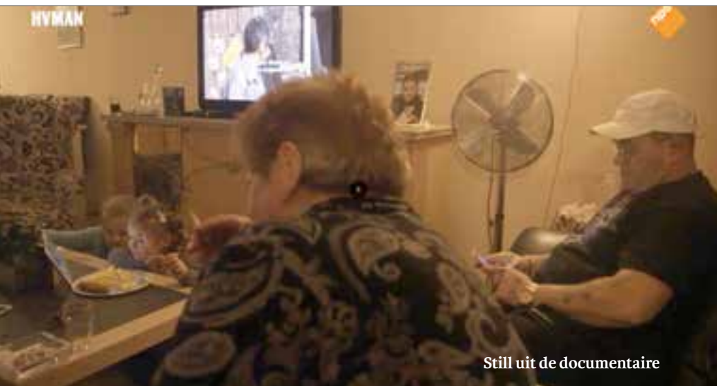
Still uit de documentaire

Degenen met de laagste inkomens en grootste schulden betalen bovenmatig mee aan de schuldenindustrie. Ester: 'In tegenstelling tot wat veel Nederlanders, calvinisten als we zijn, menen te weten is een on-