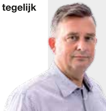
Emile Roemer fractievoorzitter SP

Ik ga ervan uit dat de partijen die nu een regering proberen te vormen die boodschap serieus nemen. Té lang hebben we kabinetten gehad die blind waren voor de gevolgen van hun bezuinigingsbeleid. Verandering is onontkoombaar!