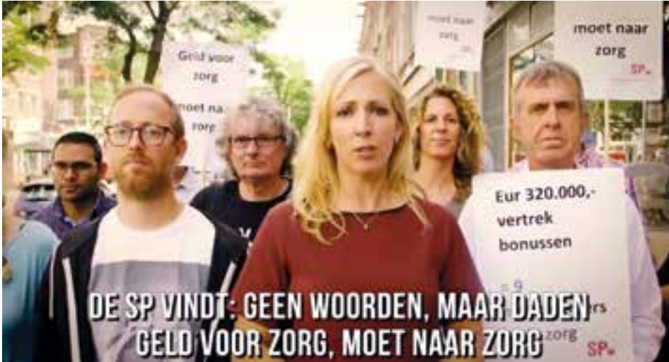
stills, archief SP