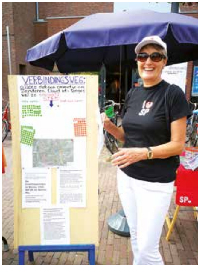
De straat op tijdens de Melbuul'n-dagen: ‘Dan merk je toch weer de waardering.’

Als het gaat om het ‘waarom’, komen in het geval van Borne typische kenmerken van het platteland naar voren. ‘Veel jongeren trekken weg uit de plattelandskernen naar de stad en worden daar actief. Borne ligt zeg maar tussen de stedelijke gebieden van Almelo, Hengelo en Enschede. Overall in Twente merk je die aanzuigende werking – bijvoorbeeld ook op scholen. Daarnaast