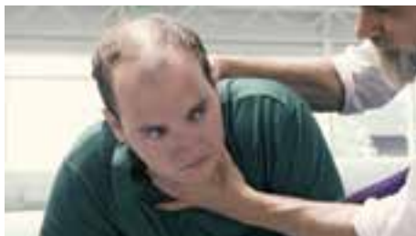
stills archief ROOD

ROOD blijft campagnevoeren tegen de bungelbanen. Met een opvallend filmpje over een 'flexremistische werkgever' wordt aandacht gevraagd voor de machteloze positie van mensen met een bungelbaan. Hier te bekijken: sp.nl/Z3j