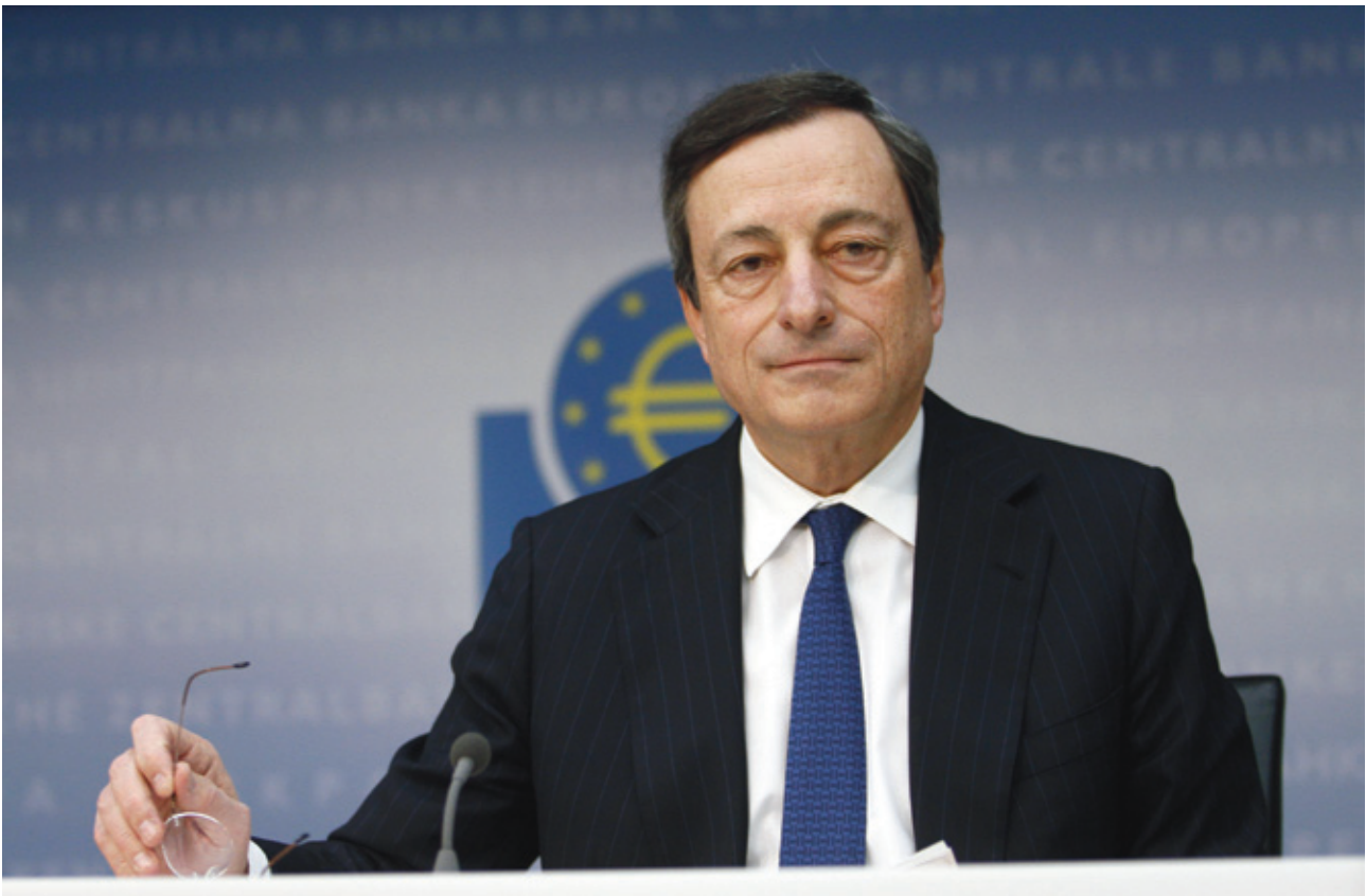
Mario Draghi, ongekozen president van de Europese Centrale Bank (ECB) met verregaande financiële bevoegdheden.