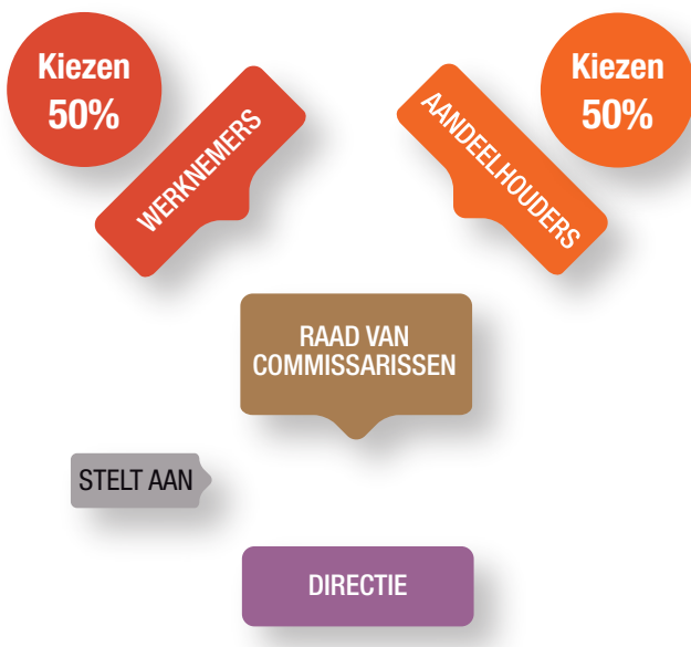
Figuur 3. Voorgestelde bestuurorganisatie van grote bedrijven