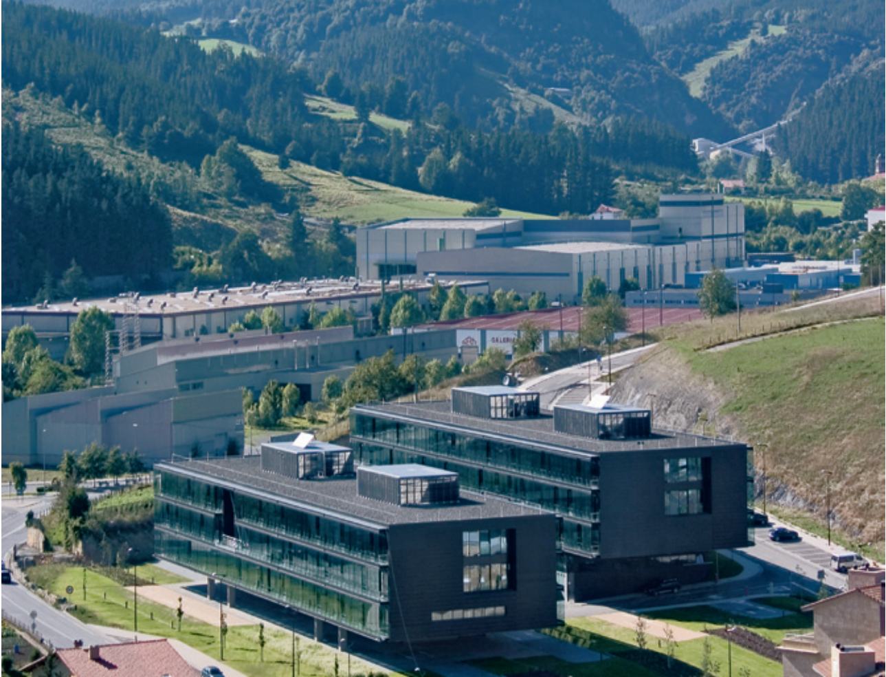
Polo Garaia een van de coöperaties van Mondragón