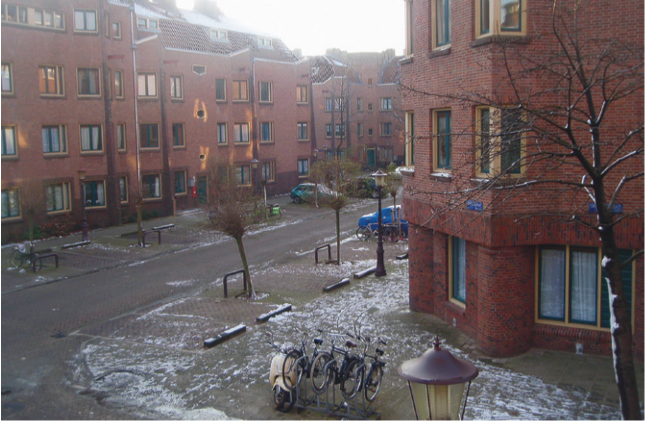
Een prachtig voorbeeld van sociale woningbouw in Nederland: de Diamantbuurt in Amsterdam.