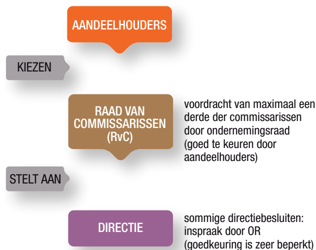
Figuur 1. Huidige bestuurorganisatie van grote bedrijven

de commissarissen gekozen door uitsluitend de aandeelhouders. De RvC stelt de voordracht voor zijn eigen opvolgers op (vandaar dat commissarissen veelal uit dezelfde klik komen). De ondernemingsraad kan voor maximaal een derde van de commissarissen een 'bijzondere voordracht' doen aan de RvC, die deze