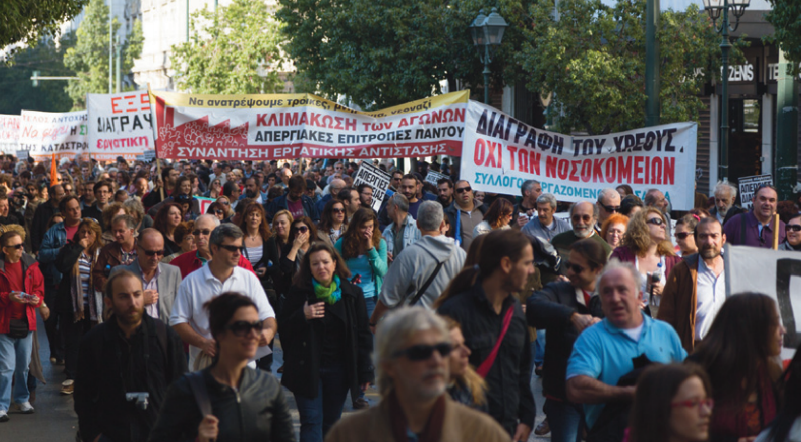
Op 14 november 2012 demonstreerden tienduizenden Europese werknemers tegen de keiharde bezuinigingsmaatregelen van hun regering. In Athene kwamen tussen de 5000 en 10.000 demonstranten bijeen.